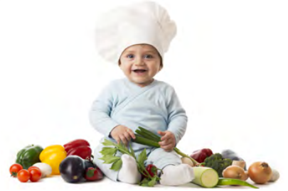
IMAGE CORPORELLE ET RELATION AVEC LES ALIMENTS: POUVONS-NOUS LES INFLUENCER CHEZ LES TOUT PETITS ?

L'attitude et les pratiques éducatives des personnes en relation quotidienne avec les tout-petits peuvent influencer sur le développement de l'image corporelle de ces derniers de même que sur la relation qu'ils entretiennent ou qu'ils entretiendront plus tard avec la nourriture.