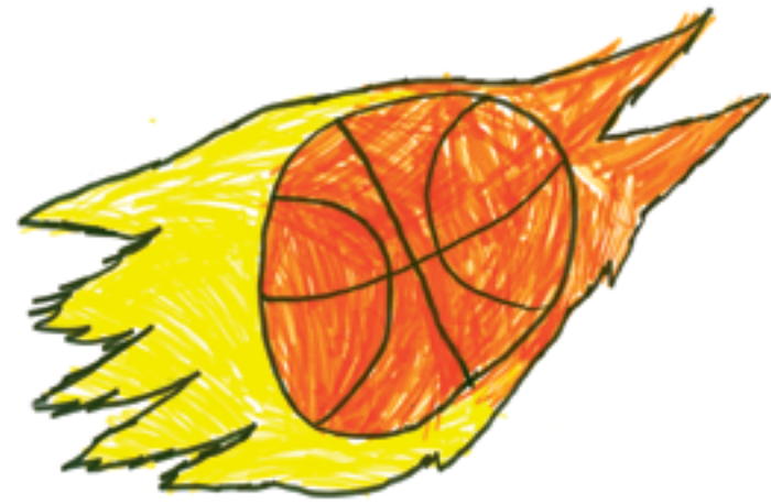
Jouer au basket