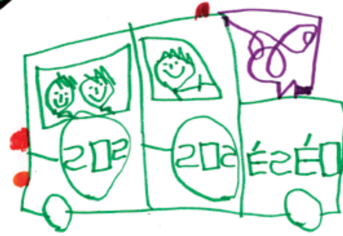
Jouer à l'ambulance