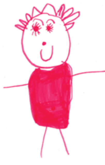
Jouer à la poupée