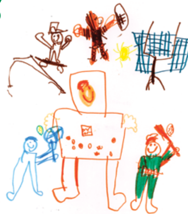
Jouer au ping-pong