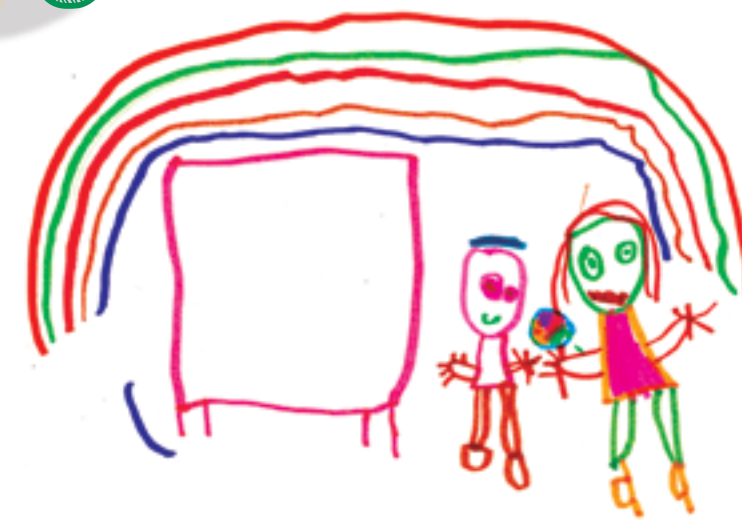
Jouer à l'école