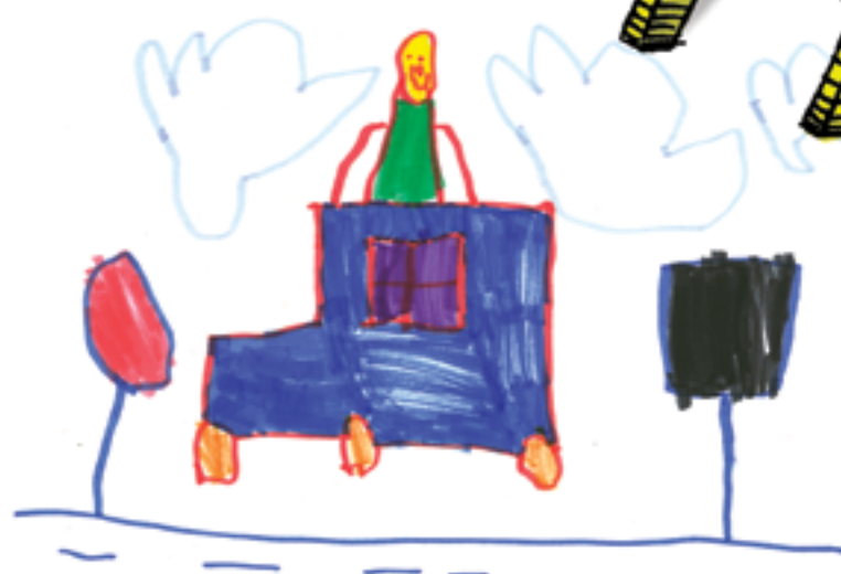
Jouer avec mon auto