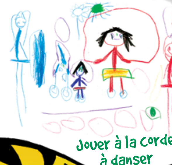
Jouer à la corde à danser