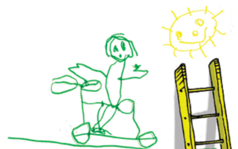
Faire du vélo