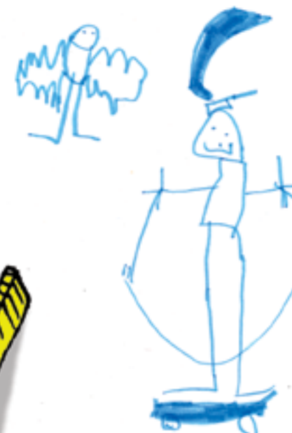
Jouer à la planche à roulettes