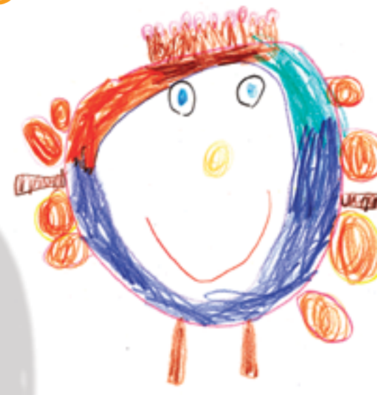
Jouer avec mon ballon