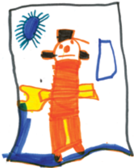
Jouer au robot