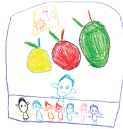
Le jeu « La pomme rouge, jaune, verte! »