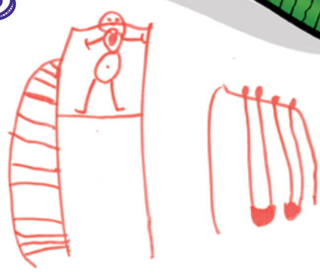
Glisser et me balancer