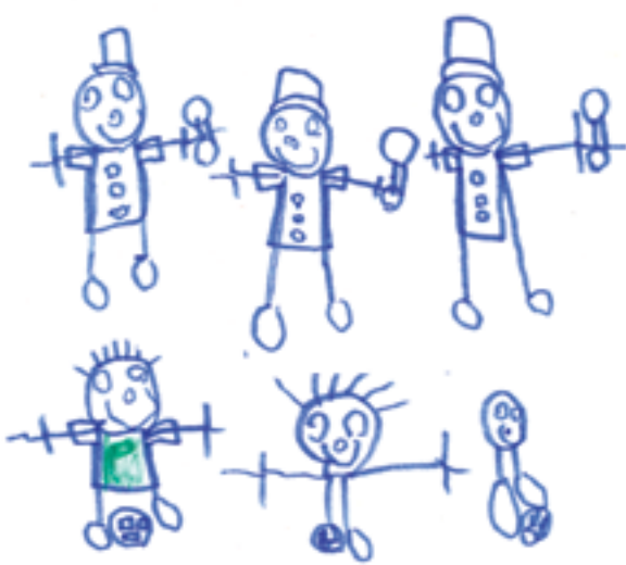
Jouer à « police et voleur »