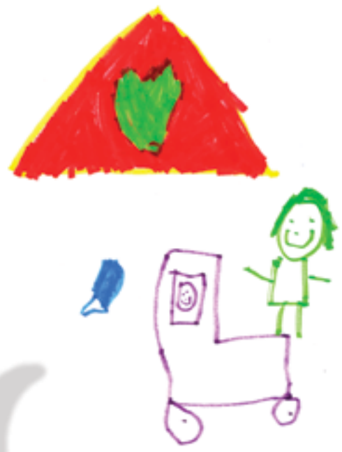
Jouer à la maman