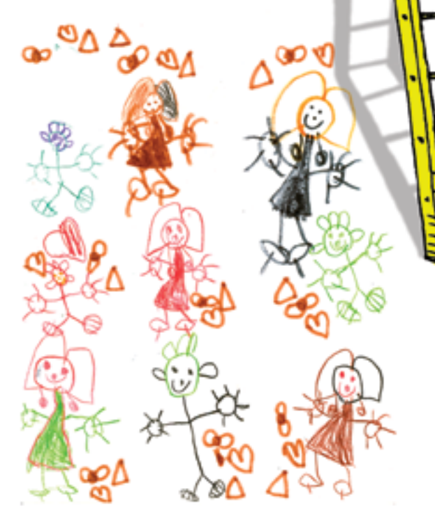
Jouer au jeu « yoptimal »